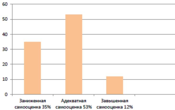
Рисунок 1 - Результаты самооценки подростков, вовлеченных в субкультуры

Анализ ответов подростков позволяет сделать вывод, что подавляющее большинство (9 подростков)(53%) имеют адекватный уровень самооценки, что свидетельствует об их адекватности восприятия себя и окружающего мира. Завышенную самооценку имеют 2 подростка (12%), 6 (подростков)(35%) имеют заниженную самооценку. Также анализ результатов показал, что самооценка у всех подростков, вовлеченных в молодежные субкультуры, характеризуется как заниженная.